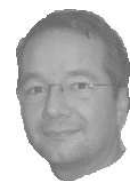
Pierre Vabre La Bastide du Salat